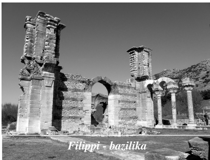
Filippi - bazilika

Jsme svědky toho, jak Pán působí, když mu člověk skutečně otevře srdce. (srov. Sk 16, 13-15) Pavel také naplno vstupuje do rozmanitého světa řeckých mýtů a pověr.